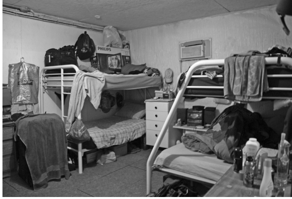
Interior de la casa donde habitan los hombres del PTAT, Joliette, Quebec.

Es importante mencionar que suelen vivir en las propias granjas, regularmente muy cerca del empleador, lo que coarta la posibilidad de que se relacionen con personas ajenas al ámbito laboral, pues se sienten intimidados por la presencia constante del patrón.