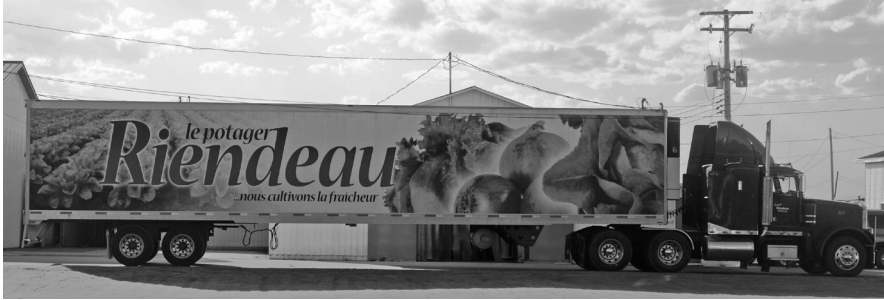
Le Potager Riendeau es una de las mayores granjas de Saint-Rémi, Quebec.

tema de reclutamiento no es privativo de la agricultura; se aplica en cualquier tipo de empleo que sea necesario cubrir si no existen nacionales con la disposición o habilidades para realizarlo.