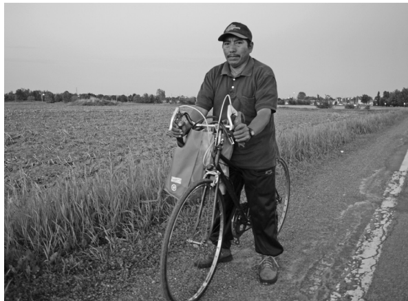
Participante del PIAT camino a casa después de comprar víveres, Saint, Rémi, Quebec.

Es un hecho que los jornaleros y jornaleras están aislados y prácticamente solos, esto se debe a que las zonas de cultivo en Canadá se encuentran alejadas de las urbes y la mayoría no cuenta con medio de transporte o, si acaso, dispone de una bicicleta, por lo que resulta prácticamente imposible recorrer grandes distancias después de sus extenuantes horas de trabajo. Tampoco existen condiciones seguras para el uso de este vehículo en las zonas rurales.