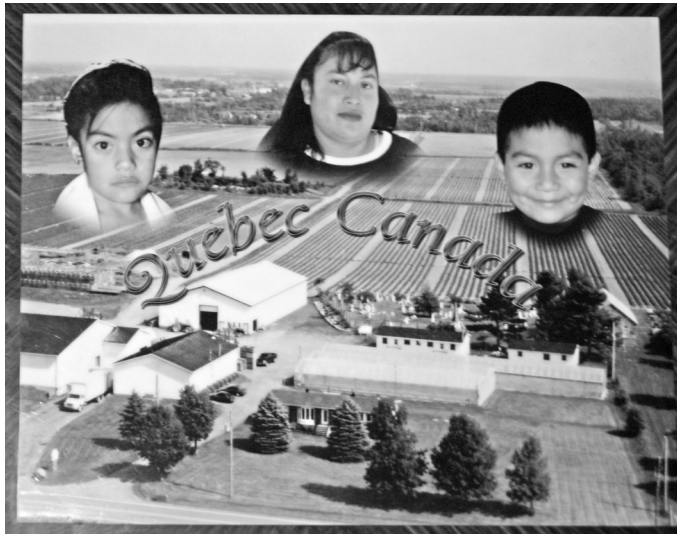
Fotografías de la familia del migrante sobrepuestas en la imagen de una granja en Saint-Rémi.

Durante mucho tiempo, los impactos no económicos de este tipo de programas han quedado al margen de los discursos oficiales, en los que suelen resaltar los beneficios materiales que la migración genera para los trabajadores campesinos en el marco de estos esquemas de contratación; sin embargo, se han publicado investigaciones especializadas en los efectos de la migración “temporal” sobre la salud de sus protagonistas; al respecto puede consultarse a Encalada (2018), Díaz y McLaughlin (2016), Narushima et al. (2016), Pysklywec et al. (2011), McLaughlin et al. (2017), Amar et al. (2009); sobre las relaciones entre migrantes y comunidades de acogida, Díaz (2015, 2014), Díaz et al. (2017), Cecil y Ebanks (1991), Smart (1997: 203-239), Preibisch (2004), Bauder et al. (2003), y acerca de sus prácticas sexuales y relaciones de género, Becerril (2008) habla ampliamente.