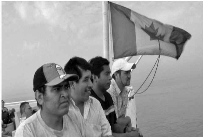
Participantes en el PTAT se dirigen en el ferry al centro de trabajo en Pelee Island, Ontario.

Las migraciones humanas a nivel global son una de las prácticas más antiguas; sin embargo, a partir del siglo xx hombres y mujeres se desplazan a petición de empresarios vía acuerdos bilaterales entre gobiernos o de agrupaciones privadas, lo que regularmente no los exime de volverse objeto de abusos. Desde 1974, Canadá contrata, a través del PTAT, a varones mexicanos y caribeños, y desde 1998 también a mujeres, para laborar fundamentalmente en actividades agrícolas.