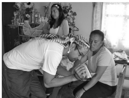
Fotograma del documental Matices... Escena en la casa de Vicky, Puebla, México.

De una manera similar al trabajo de Min Sook Lee, Matices... (2011) surgió para visibilizar las condiciones de maltrato de las cuales son objeto los jornaleros. Mientras me encontraba en el centro de apoyo ATA en Leamington, Ontario, 4 un grupo de migrantes mexicanos provenientes de una de las granjas de Chatham, poblado localizado aproximadamente a 50 kilómetros de donde yo estaba, llegaron a denunciar las pésimas condiciones de trabajo y vivienda en las que se encontraban. Pidieron mi apoyo debido a que tenía una cámara de video en mis manos. Querían que hiciera algunas tomas de su vivienda para poder llevarlas a la STPS y así sustentar sus argumentos, ya que decían que en esa oficina no les creían.